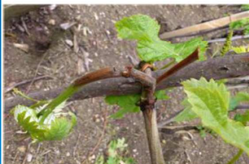
A Peroxa. Mencia - Botrite (05.05.2012)