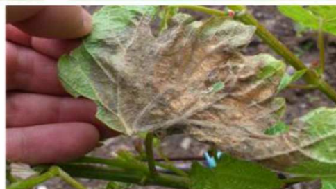
A Peroxa. Mencia - Botrite en folia (05.05.2012)