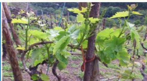
A Peroxa. Mencia - estado fenológ. (05.05.2012)